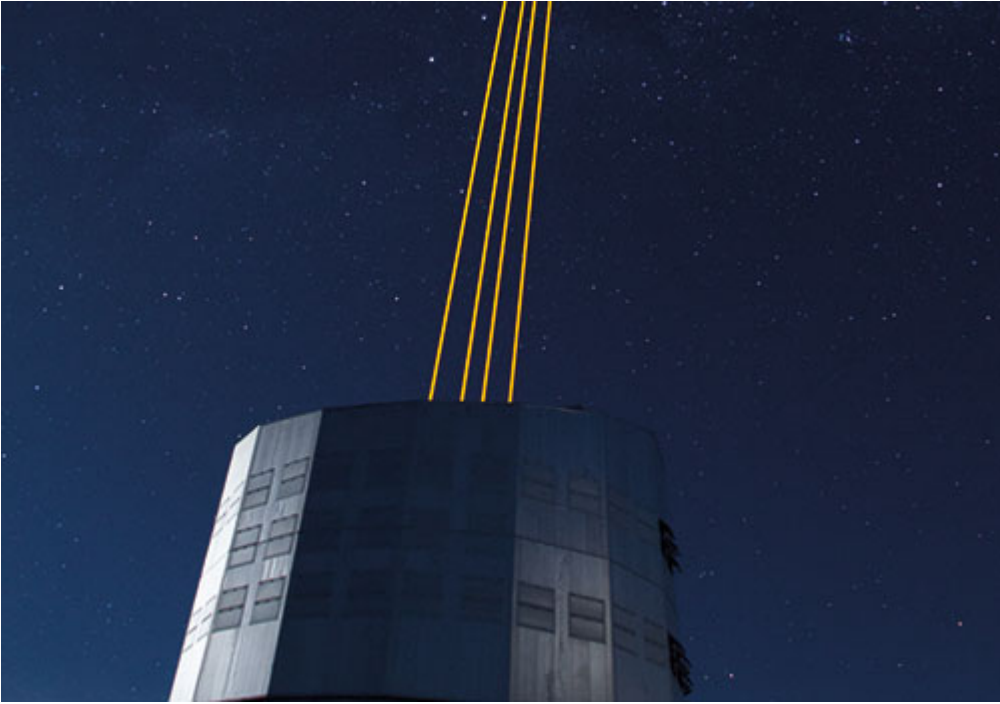
633 nm High Power