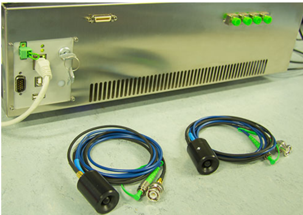
633 nm High Power