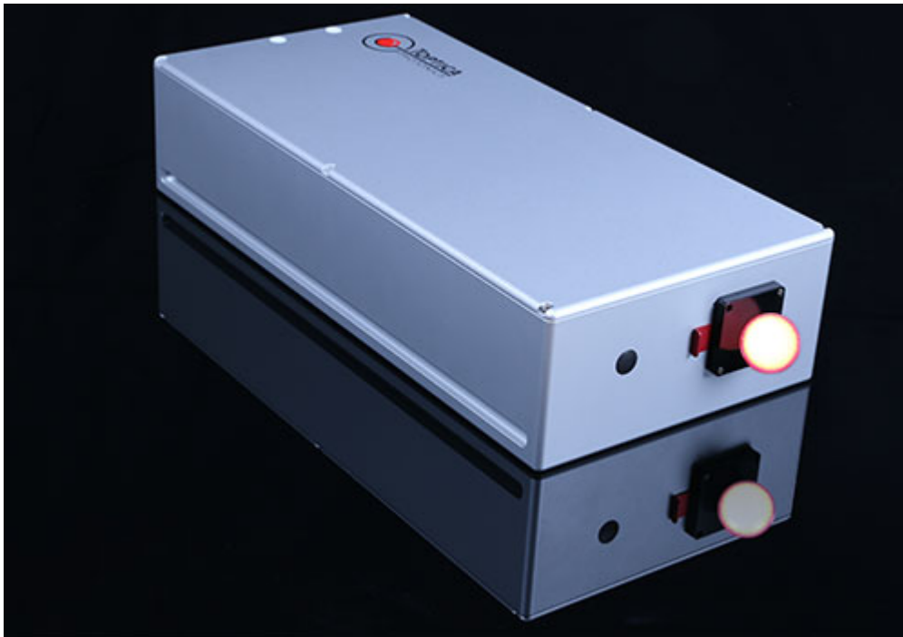
213 nm 10 mW cw