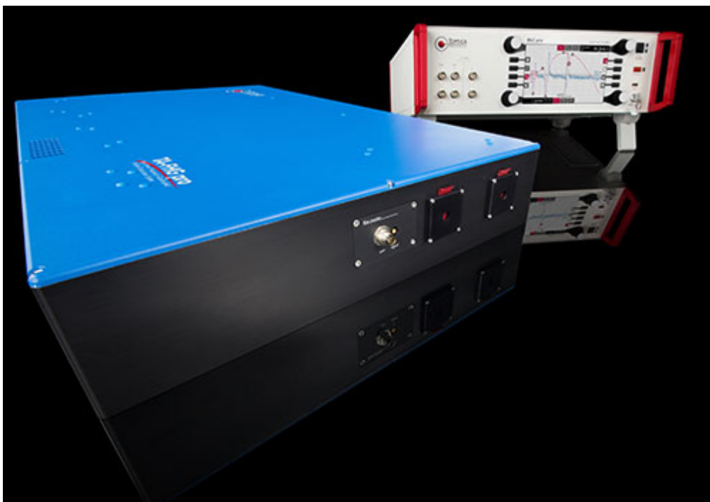
193 nm sub-mW